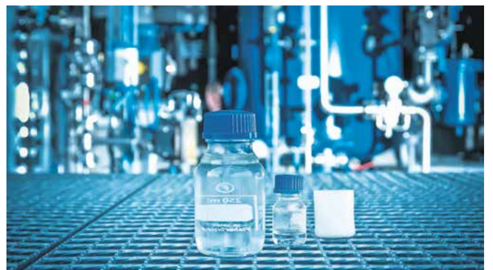
Blue Crude: Der synthetische Diesel ist glasklar und sauber

Der nachhaltige Kraftstoff ist in mehrfacher Hinsicht gut fürs Klima: Er ist sauber und effizient. Außerdem ermöglicht er, dass die bestehende Infrastruktur – von der Logistik bis zur Ausgabe an den Tankstellen – unverändert genutzt werden kann. Auch eine technische Umstellung der Motoren auf den neuen Brennstoff ist nicht notwendig. ■