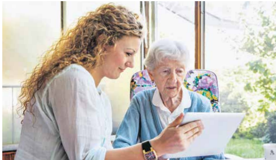
Auch in der Altenpflege: Die Technik assistiert, damit mehr Zeit für den Menschen bleibt

Für die Lebensmittelsicherheit wurden in Bonn, Jena und Berlin mobile Minilabore entwickelt. Mit ihrer Hilfe werden Lebensmittel direkt vor Ort auf Krankheitserreger und deren Konzentration untersucht. Ein innovatives Softwaresystem ermöglicht außerdem die Rückverfolgung der Lebensmittel vom Verbraucher bis hin zum Hersteller. Im Falle einer Verunreinigung wäre diese Nachverfolgung sehr wichtig, um schnell reagieren und Menschen schützen zu können. ■