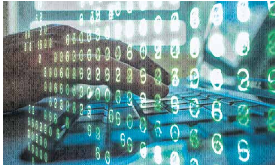
Die digitale Vernetzung des Alltags bietet Kriminellen zunehmend Angriffsflächen

Auch gegen Betrügereien im Internet, etwa beim Online-Banking oder beim Online-Einkauf, entwickelt die Forschung Lösungen. Bislang war etwa die Auswertung unzähliger Kundendaten notwendig, um Muster bandenmäßiger Online-Krimi-